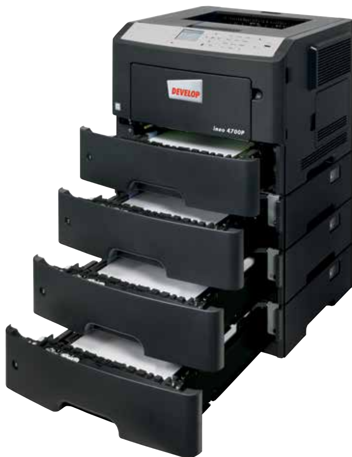
ineo 4000P com 3 cassetes adicionais (PF-P12)

Caso o sistema operativo da sua impressora atual seja difícil de seguir e o equipamento seja difícil de usar, está na hora de considerar mudar para a ineo 4700P. O seu painel a cores de 2.4 polegadas garante uma operacionalidade intuitiva e menus destacados mostram aos utilizadores o estado do sistema, opções de operação e configurações. E mais, um conceito de navegação tipo pasta significa que a ineo 4700P é mais fácil de utilizar que qualquer outro sistema mais antigo. Isto poupa tempo e esforço à sua equipa na impressão de trabalhos diários. E ninguém terá de consultar o manual de operador antes de usar esta nova impressora.