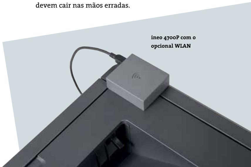
ineo 4700P com o opcional WLAN

Caso não tenha muito espaço no seu escritório ou precisa mesmo de uma impressora de mesa, o desenho leve e pegada reduzida da ineo 4700P são uma grande vantagem. O facto que esta impressora eficiente de escritório poderá ser colocada com facilidade em cima de uma mesa e não precisa de um próprio espaço, é extremamente conveniente para uma equipa por exemplo num departamento de RH ou financeiro, onde documentos confidenciais não devem cair nas mãos erradas.