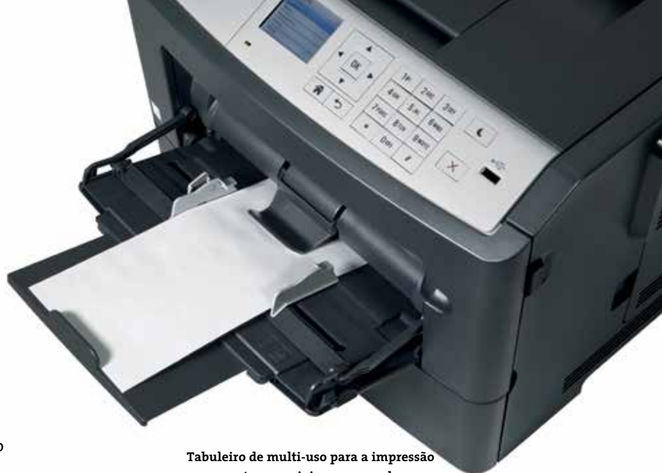
Tabuleiro de multi-uso para a impressão em suportes especiais como envelopes

Trabalhos de impressão de alto volume são comuns no seu negócio? Com uma capacidade máxima de 2,300 folhas pode ter a certeza de que a ineo 4700P não ficará sem papel. E caso frequentemente imprima em vários tipos de papel, por exemplo com ou sem papel timbrado, poderá equipar a sua ineo 4700P com até três cassetes de papel (com 250 ou 550 folhas). Caso as cassetes tenham papel de tipo, formato e gramagem diferente (A6-A4 e 60-163 grs), poderá garantir que a sua equipa não perde tempo trocando de um tipo de papel para o outro, ou voltar para a impressora que ficou sem papel.