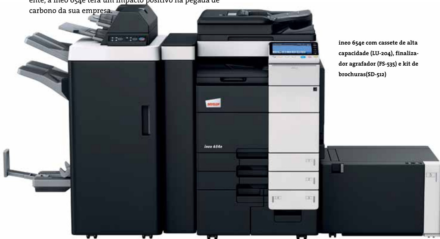
ineo 654e com cassette de alta capacidade (LU-204), finalizador agrafador (FS-535) e kit de brochuras (SD-512)

Ataques de hackers, vírus, programas Trojan: nos dias que correm, nenhum negócio pode dar-se ao luxo de ignorar o desafio que representa a segurança informática. É por esse motivo que a ineo 654e está certificada pela ISO 15408 EAL 3, que é a norma de segurança da indústria para os sistemas multifuncionais. Além disso, também está equipada com inúmeras características de segurança de dados, como a encriptação IPsec, que assegura canais de comunicação para todos os documentos que passam através da rede da sua empresa. Não existe o perigo de documentos ou dados confidenciais irem parar às mãos erradas, porque o acesso ao sistema pode ser restringido a utilizadores autorizados através do kit de encriptação do disco rígido standard e da tecnologia de autenticação. Desta forma, garantimos que os seus dados sensíveis se mantêm seguros – agora e no futuro.