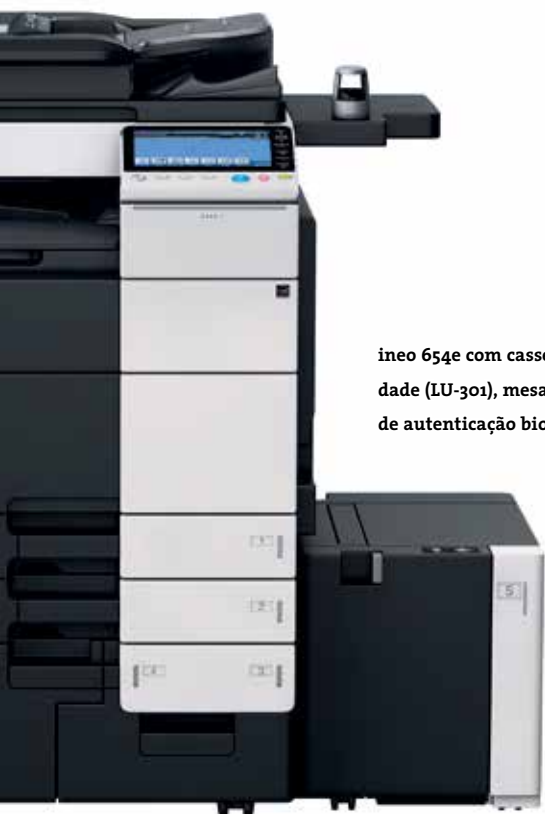
ineo 654e com cassete de alta capacidade (LU-301), mesa (WT-506) e unidade de autenticação biométrica (AU-102)

Acreditamos que não, porque não basta um motor mais veloz para aumentar necessariamente a produtividade do seu fluxo de trabalho documental. O que acontece antes e depois de um trabalho ser impresso é igualmente importante, e é aqui que a ineo 654e pode fazer a diferença de forma decisiva: