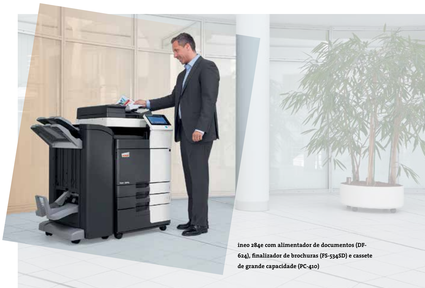
ineo 284e com alimentador de documentos (DF-624), finalizador de brochuras (FS-534SD) e cassette de grande capacidade (PC-410)

Estes sistemas a preto & branco vêm com várias características ecológicas que reduzem o consumo energético com mais de 40% comparado com os modelos anteriores. Enquanto este tipo de economia poupa dinheiro, outras características verdes são ecológicamente benéficas. E isso significa que a linha ineo “e” da DEVELOP não é apenas bom para o ambiente, mas também acelera as credenciais verdes do proprietário.