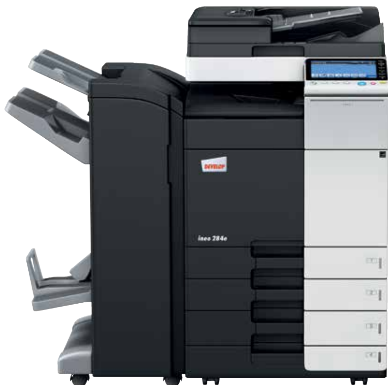
ineo 284e com alimentador de documentos dual scan (DF-701), finalizador de brochuras (FS-534SD) e cassete de papel (PC-210)

Cada um destes equipamentos multifuncionais de escritório – a ineo 224e, a ineo 284e, a ineo 364e, a ineo 454e e a ineo 554e – não é apenas fácil de usar, mas também oferece uma grande variedade de características para facilitar as tarefas diárias. Ao poupar tempo aos utilizadores na impressão, cópia ou digitalização, eles podem voltar mais rapidamente ao seu trabalho normal. E isso irá ajudar a acelerar a produtividade.