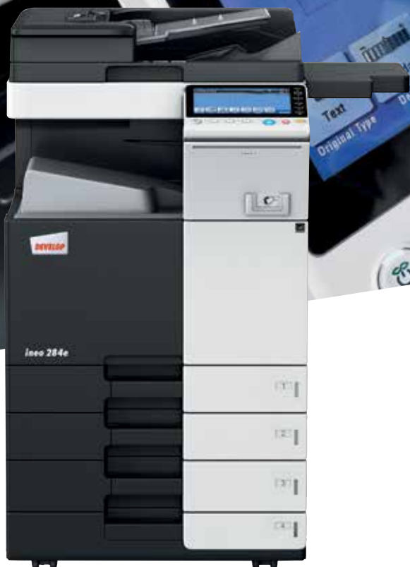
ineo 284e com alimentador de documentos dual scan (DF-701), cassette de papel (PC-210) e mesa de suporte (WT-506)