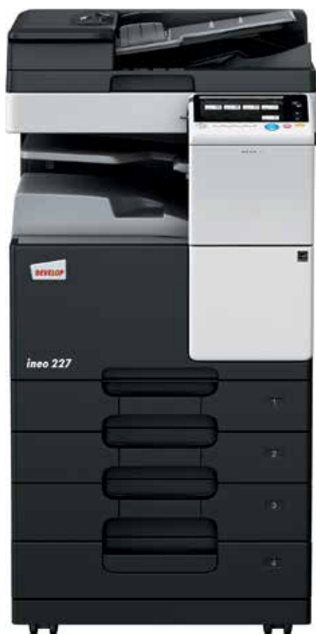
ineo 227 com alimentador de documentos (DF-628), separador de trabalho (JS-506) e cassette de papel (PC-213)