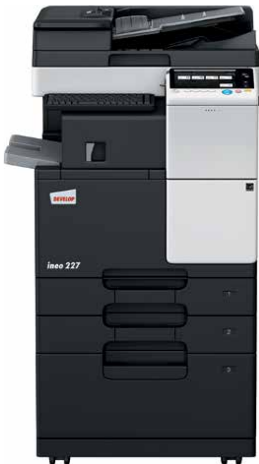
ineo 227 com alimentador de documentos (DF-628), finalizador interno (FS-533), cassette de papel (PC-413) e suporte para teclado (KH-102)

Centros de emprego, escolas e universidades, empresas de engenharia, escritórios de arquitetos, companhias de seguros, bancos, bibliotecas: muitas pequenas e médias empresas ou organizações realmente não precisam de capacidades de impressão a cores. O que os seus utilizadores realmente necessitam é um multifuncional monocromático que é fácil de usar e oferece uma usabilidade móvel simples para um número cada vez maior de colaboradores móveis.