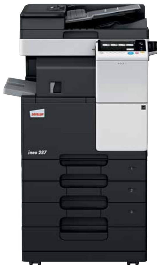
ineo 287 com alimentador de documentos (DF-628), separador de trabalho (JS-506) cassette de papel (PC-213) e teclado numérico (KP-101)