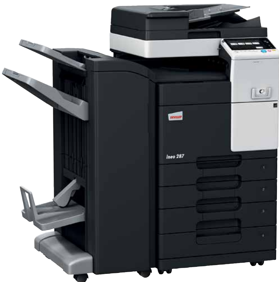
ineo 287 com alimentador de documentos (DF-628), finalizador de brochuras (FS-534SD), cassette de papel (PC-213) e kit montagem para dispositivo de autenticação por cartão (MK-735)

Os equipamentos monocromáticos representam uma variedade de funções que reduzem o consumo energético. Além de lhe poupar dinheiro, estas caraterísticas verdes também fazem bem ao ambiente – e à sua pegada de carbono.