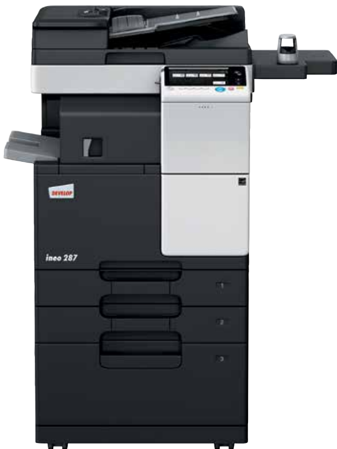
ineo 287 com alimentador de documentos (DF-628), finalizador interno (FS-533), cassette de papel (PC-413) e kit de autenticação biométrica (AU-102)

Centros de emprego, escolas e universidades, empresas de engenharia, escritórios de arquitetos, companhias de seguros, bancos, bibliotecas: muitas pequenas e médias empresas ou organizações realmente não precisam de capacidades de impressão a cores. O que os seus utilizadores realmente necessitam é um multifuncional monocromático que é fácil de usar e oferece uma usabilidade móvel simples para um número cada vez maior de colaboradores móveis.